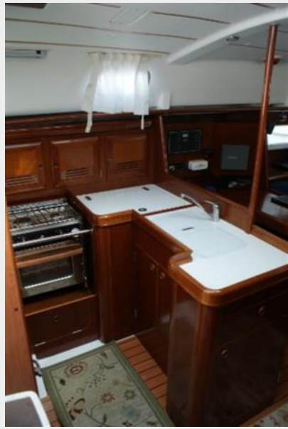
2004 Beneteau 361 Galley