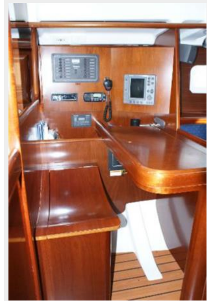
2004 Beneteau 361 Aft Cabin