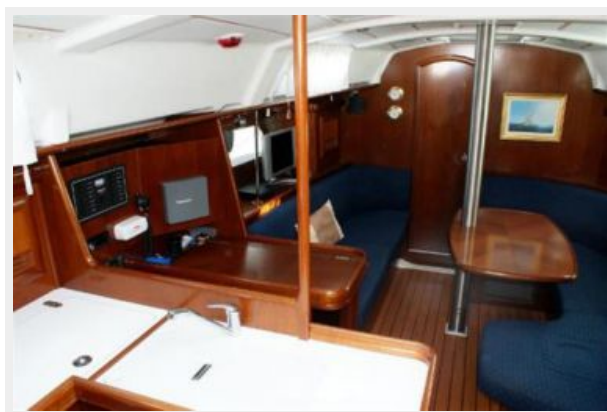
2004 Beneteau 361 Salon