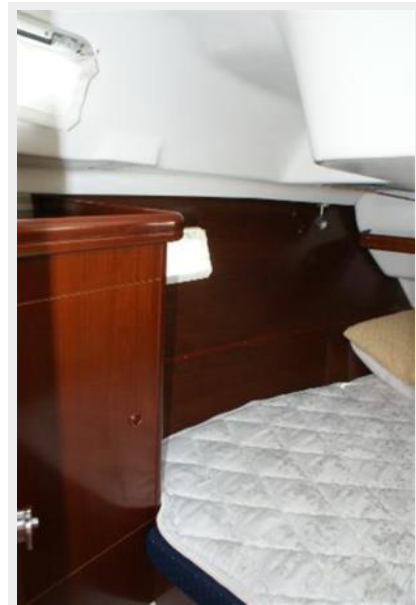
2004 Beneteau 361 Aft Cabin