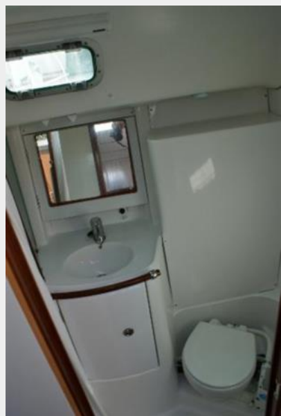
2004 Beneteau 361 Head