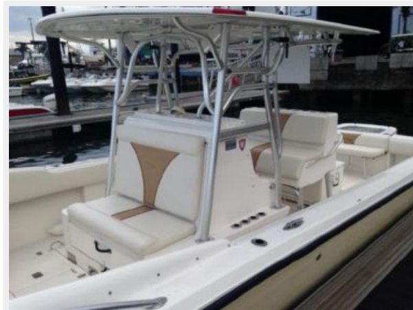
Hard Top, New Seats & Bolsters