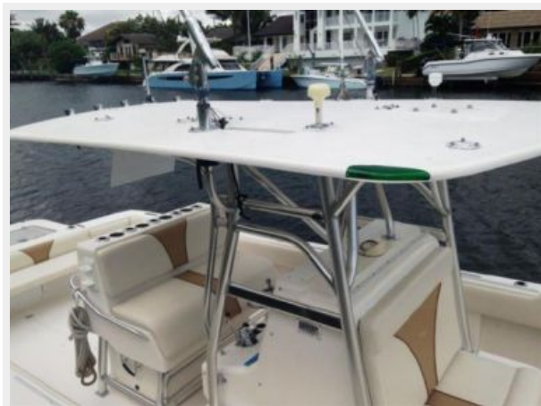
Hard Top & Outriggers, (new radar not pictured)