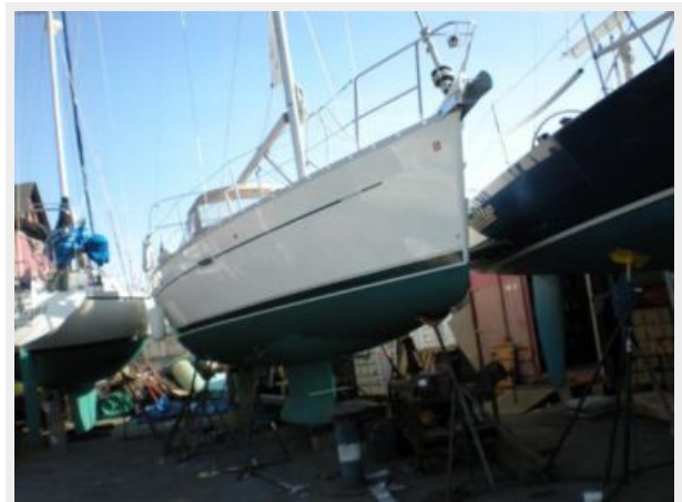
Starbord hull/ on the Hard