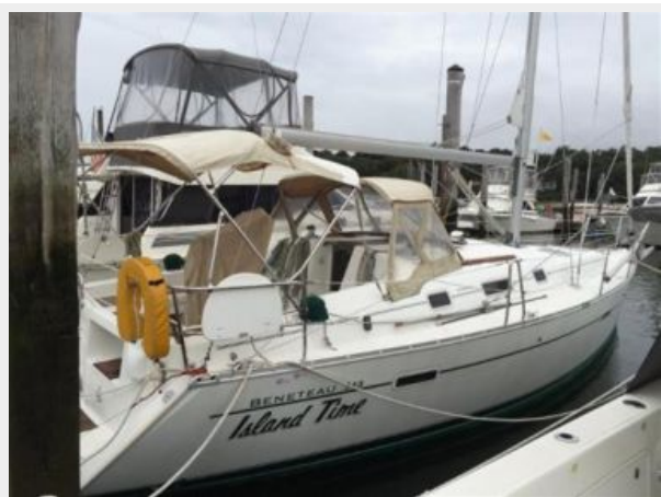
Starboard Hull at the Slip