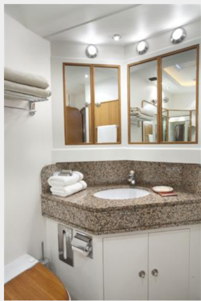
Bunk bed bathroom