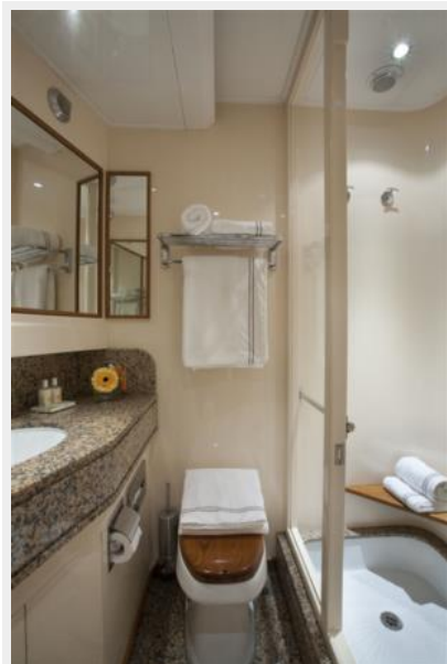
Twin cabin bathroom