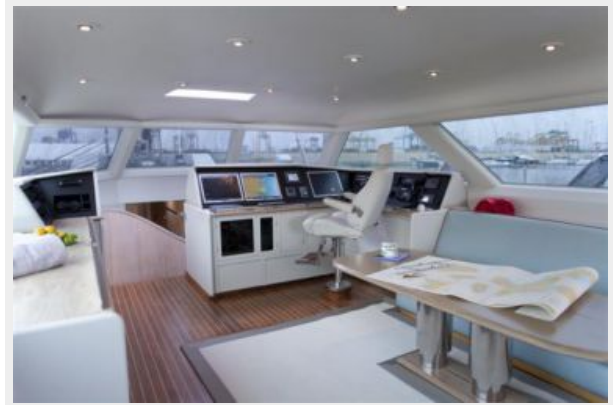
Helm & upper salon