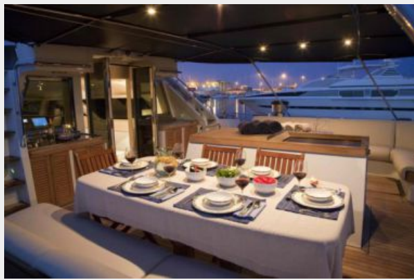
Aft deck dining