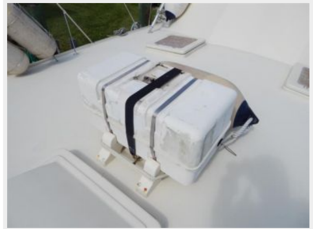
6 Man Liferaft