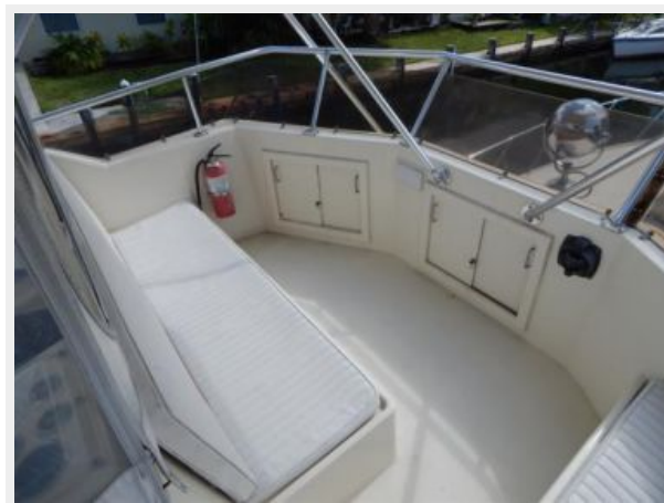
Flybridge Fwd Bench