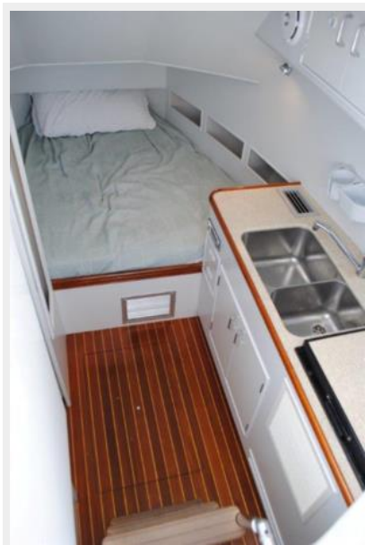
Forward V Berth