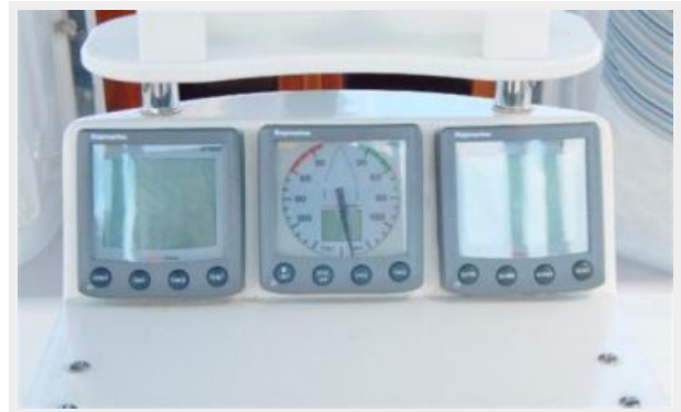
Speed, Depth, Wind