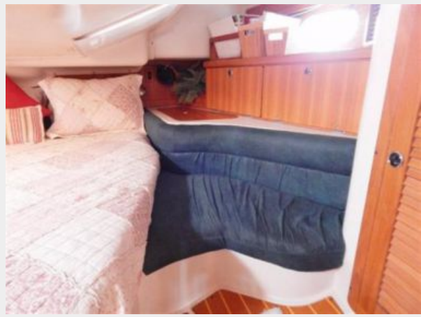
Master Berth Port