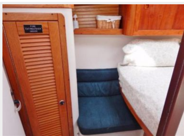
Guest Berth Port