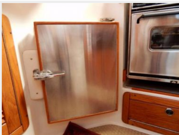
Galley Fridge Front