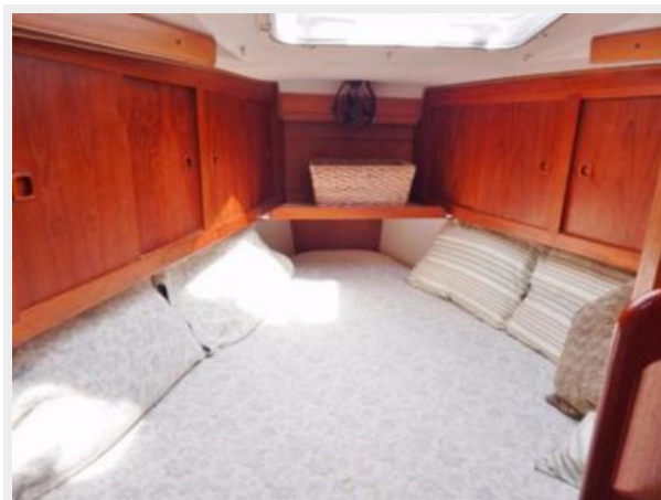
Guest Berth Forward