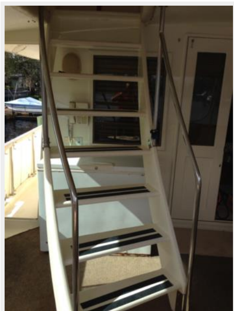
Aft Deck Staircase to Bridgedeck