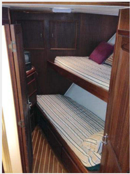
Bow Guest Stateroom #2