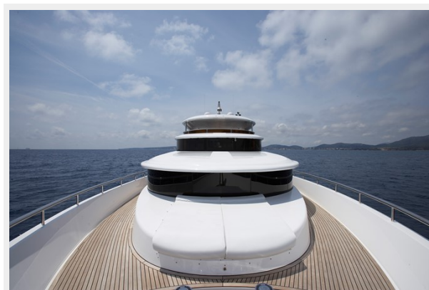
Standard teak decks