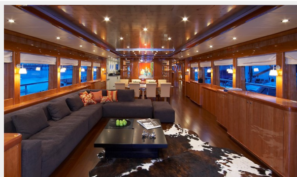
Salon looking forward