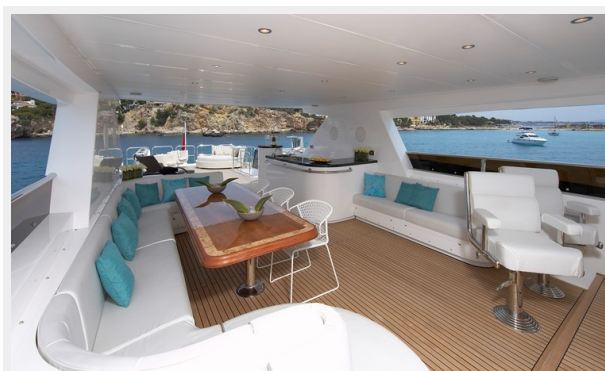
Flybridge looking aft