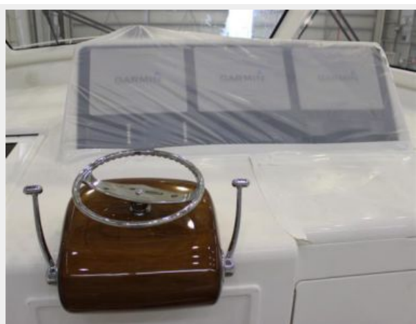
Sistership manufacturer provided photo