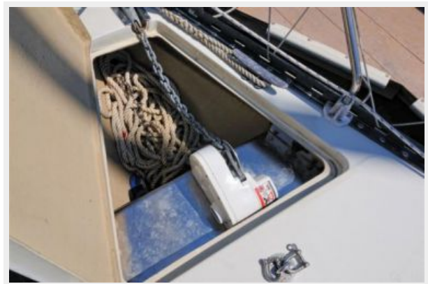
Anchor locker and windless