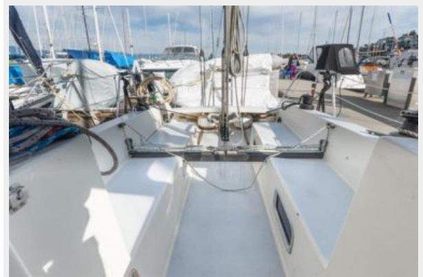
Starboard deck (new window s/s treatment)