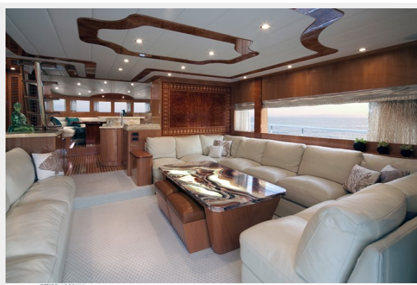
Salon looking forward