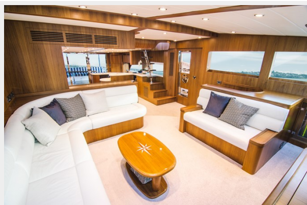
Salon looking aft