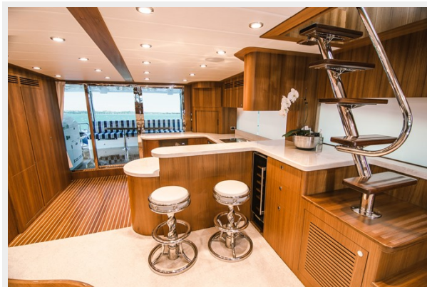
Aft galley option