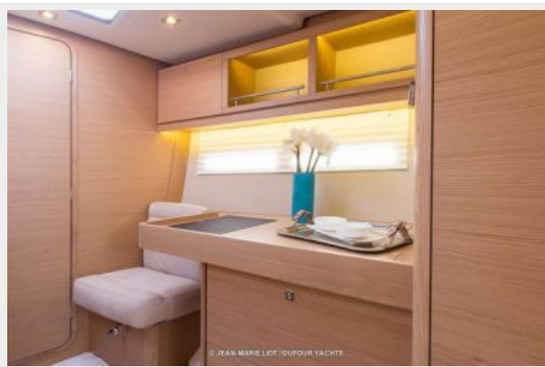
Dufour 56 E Master Vanity