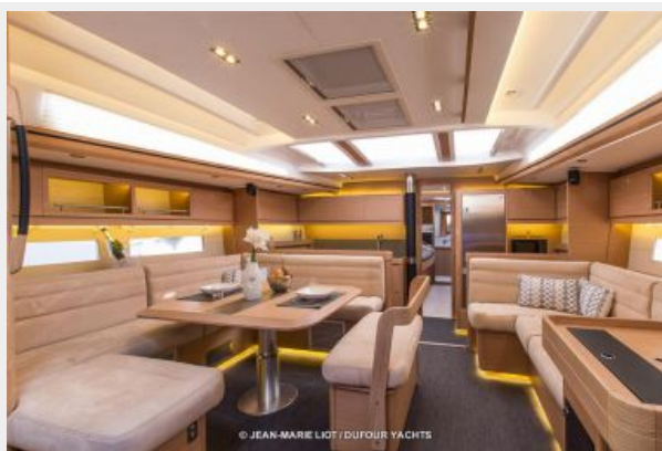
Dufour 56 E Salon