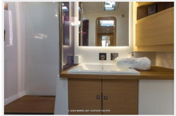
Dufour 56 E Head