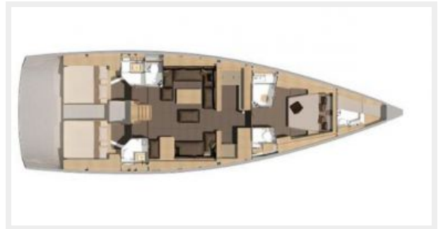
Dufour 56 E Layout 2