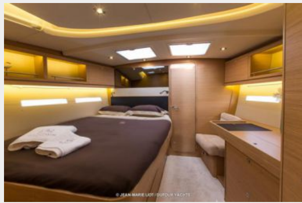
Dufour 56 E Stateroom