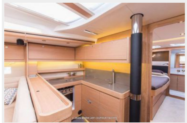
Dufour 56 E Galley