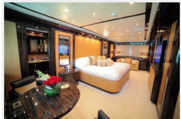
Mangusta 165 - Master stateroom