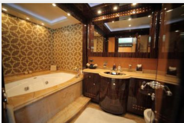
Mangusta 165 - Master bathroom