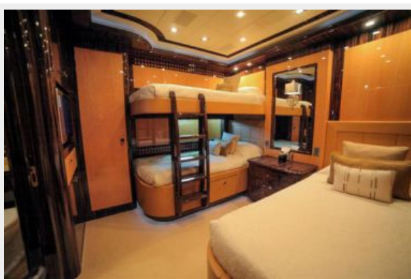
Mangusta 165 - Guest stateroom