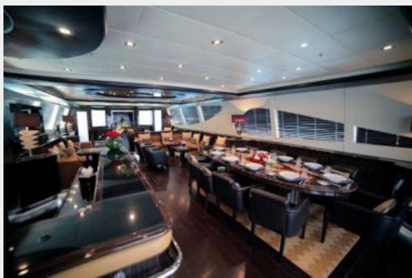
Mangusta 165 - Saloon