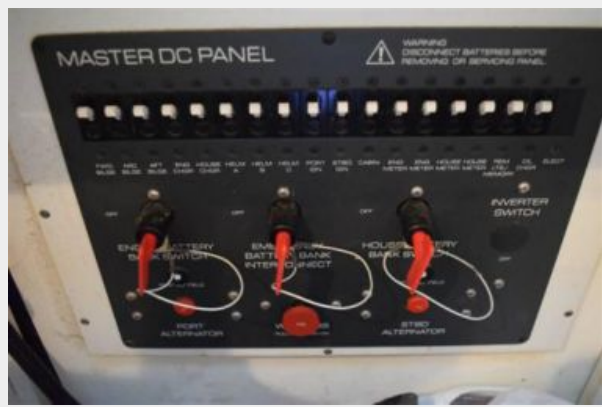
DC Electric Panel