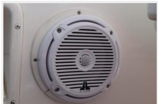
JL Audio Cockpit Speakers