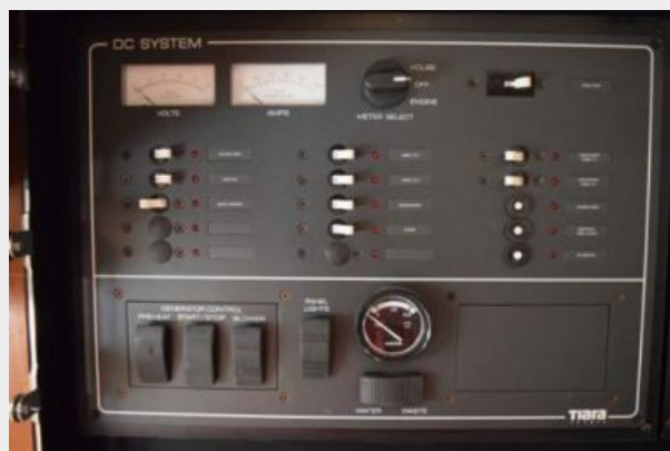
DC Breaker Panel