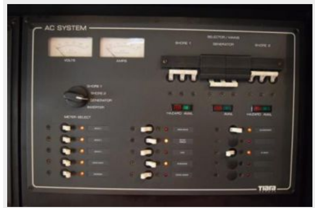
AC Breaker Panel