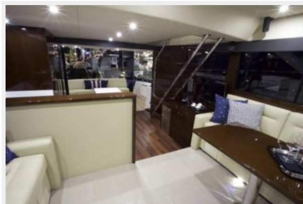
Internal Stairway to Flybridge