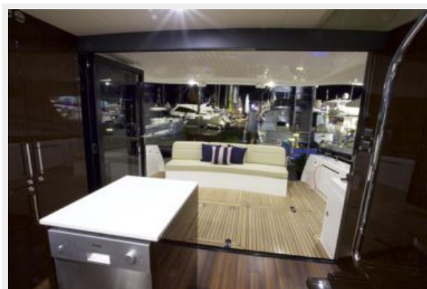
Bi-fold Doors to Cockpit