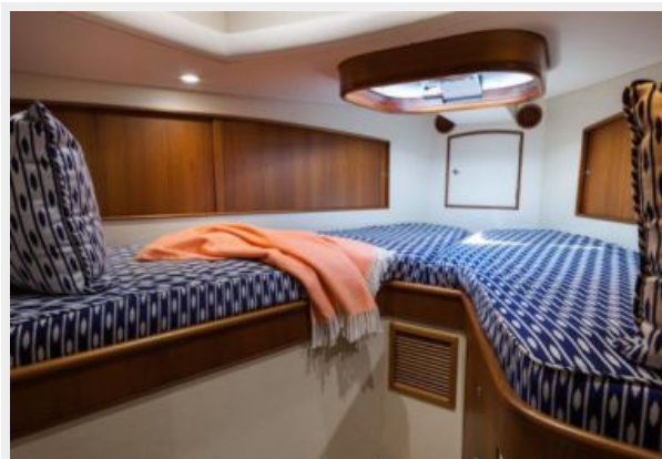
VIP Forward Stateroom