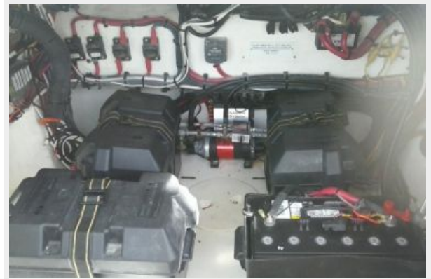
12V Master Station