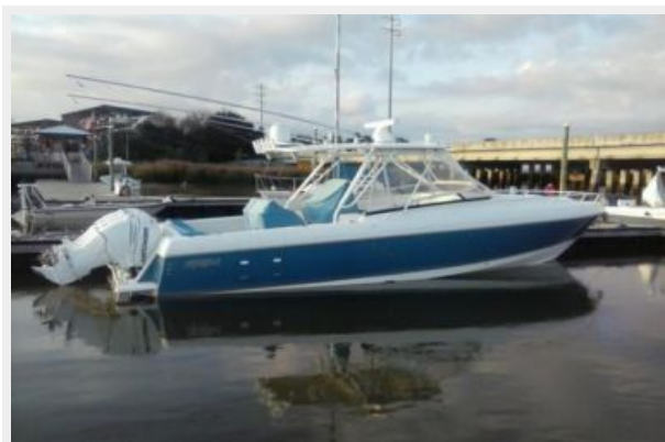
EBITDA Profile 2