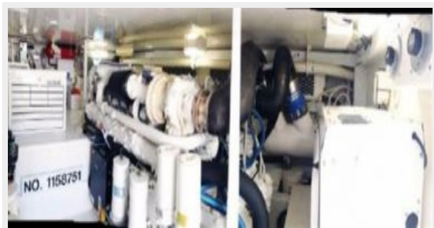
Engine Room 3