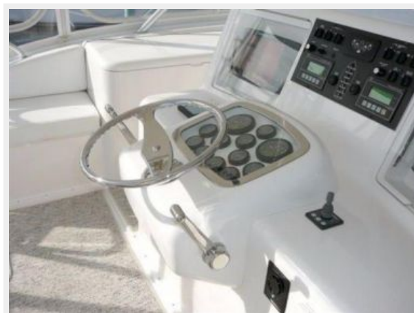
Bridge Controls 2