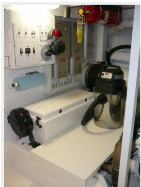
Engine Room 5