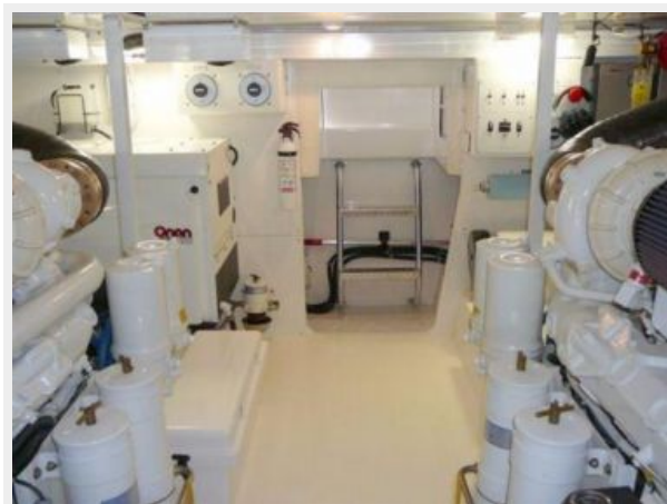
Engine Room 2