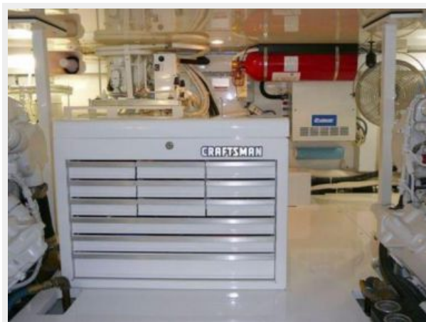
Engine Room 4