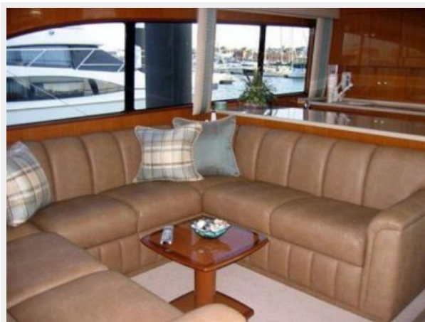
Salon Seating Area