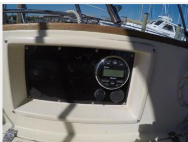
Remote for stereo