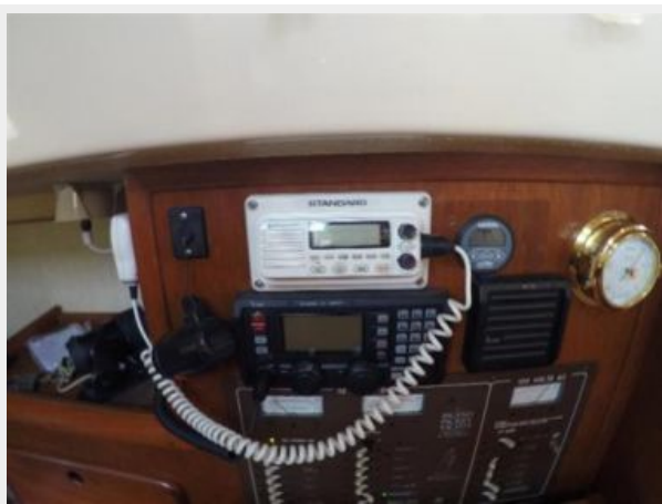
VHF and SSB