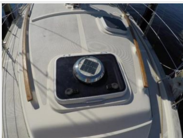
Solar hatch vent