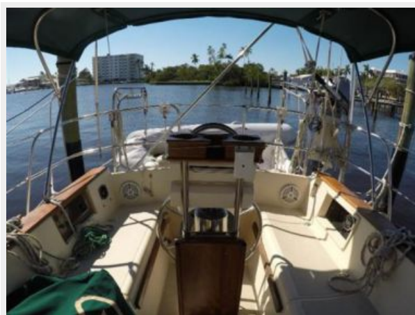
Cockpit with ease of handling