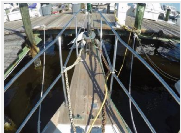
Bow pulpit with dual anchors