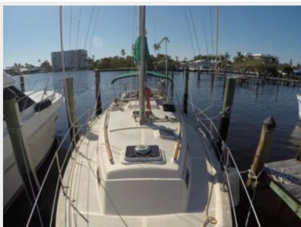
Large cabin house