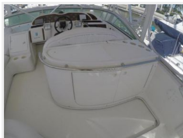
Bridge serving area