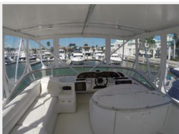
Large forward bridge