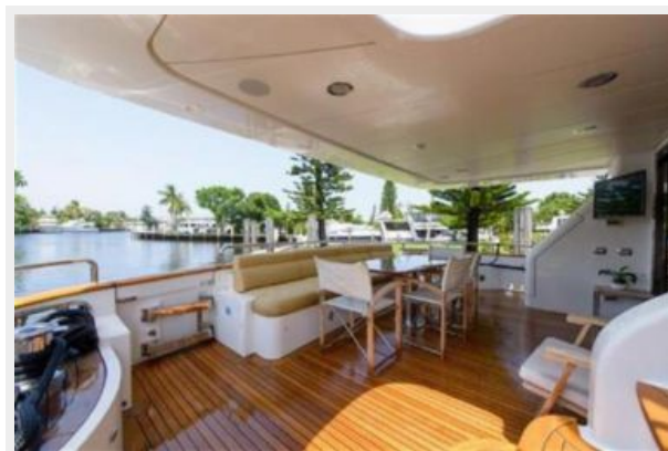
Aft Main Deck