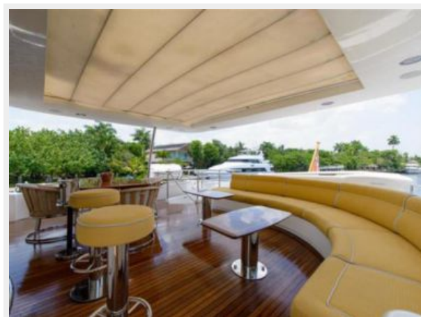
Aft Upper Deck