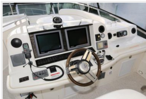
Helm Electronics (2)