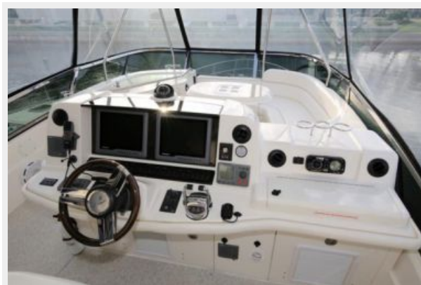
Helm Electronics (4)