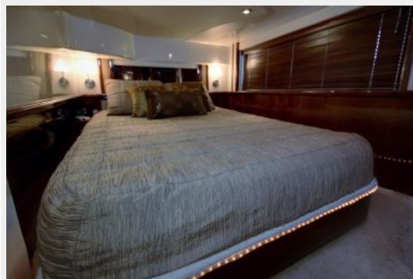
Master Stateroom (2)