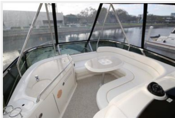
Forward Bridge Seating