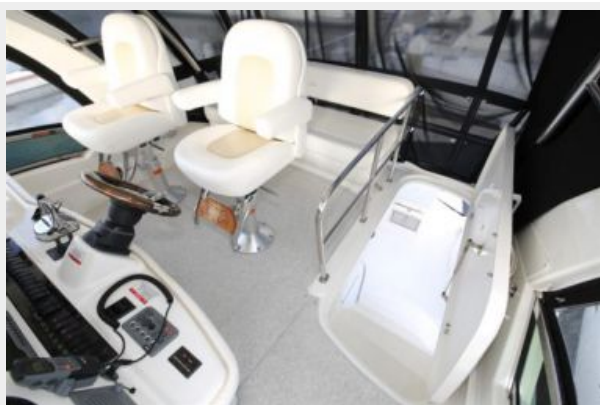
Twin Helm Chairs