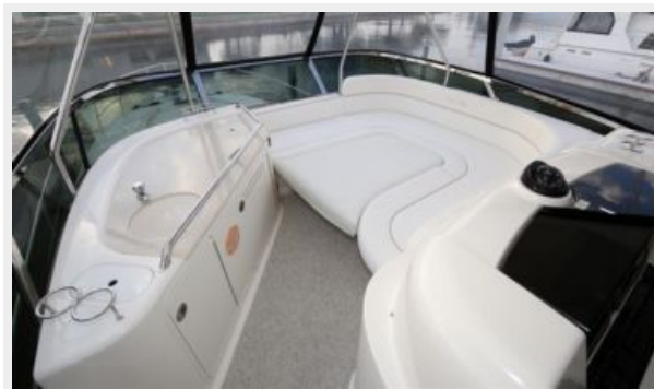
Forward Bridge Seating w/ Seat