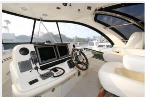
Helm Electronics (3)