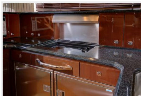
Galley Mystic Black Counter Top / Solid Surface Stove Top