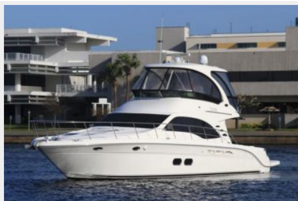
Port Bow Profile