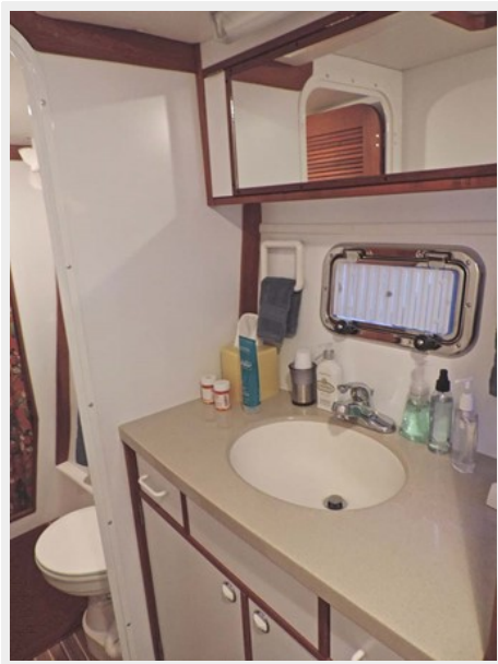
Starboard Head w/Sink, VacuFlush Toilet, Shower Stall