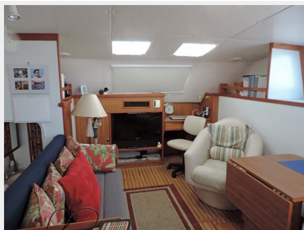
Salon w/NEW LG Flat Screen TV (2014)