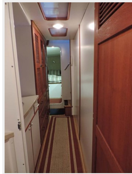
Starboard Hull Looking Aft to Stateroom from Head. Vanity just aft of Head Compartment. Storage Hanging Lockers to Starboard