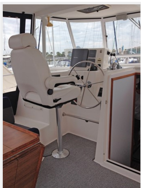
Helm Station w/Helm Swivel Seat