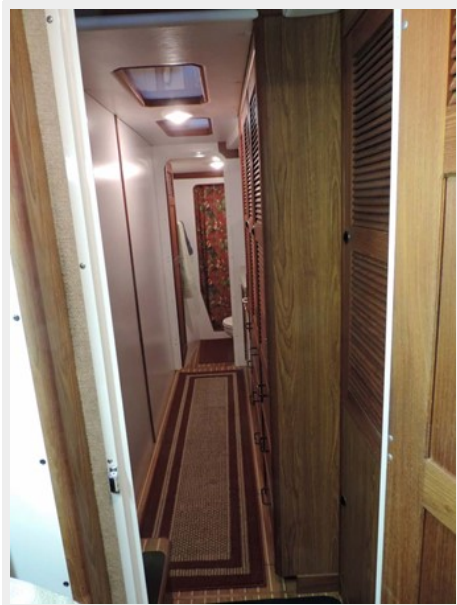
Forward View from Starboard Stateroom of Head w/Separate Shower Stall