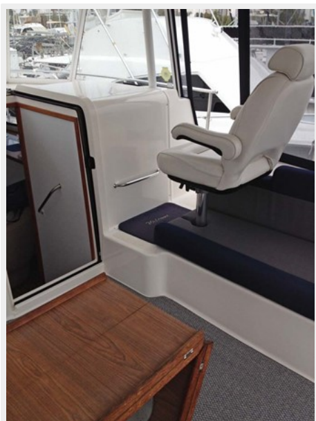
Entrance to Starboard Sidedeck for great accessibility to easily handle lines and docking