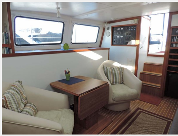
Salon Starboard Side w/twin barrel swivel chairs & fold-out table