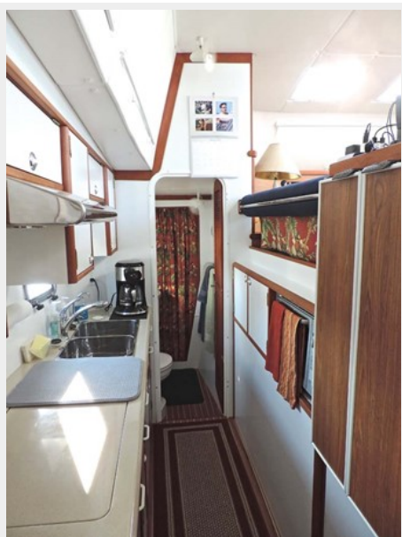
Galley in Port Hull. Stateroom is Aft and Head Compartment is forward of Galley