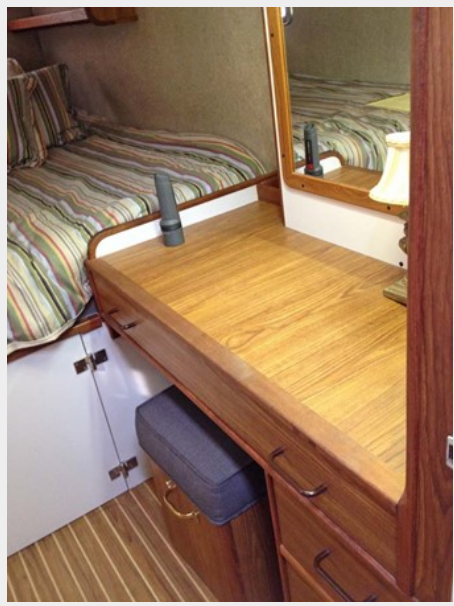
Starboard Stateroom Vanity w/Stool