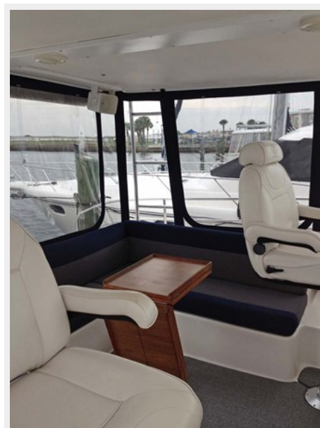
NEW Enclosure w/back & side roll-up sunshades (2014)