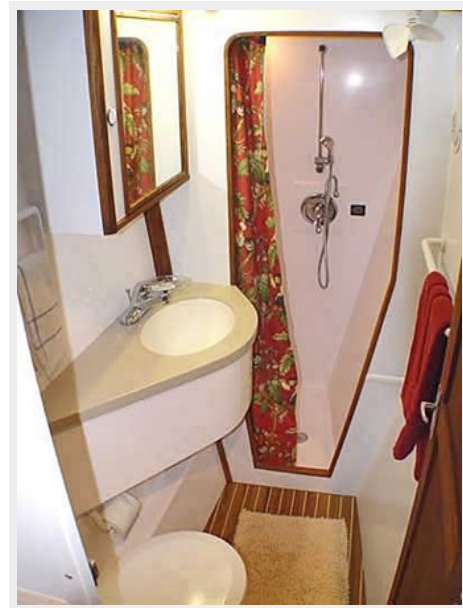
Port Head w/Sink, VacuFlush Toilet, Separate Shower Stall