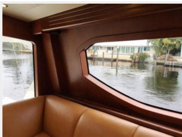
Salon Port Windows