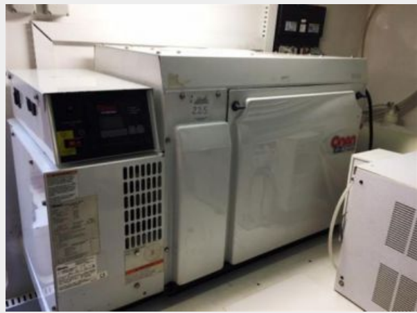
1 of 2 Onan Gen Sets