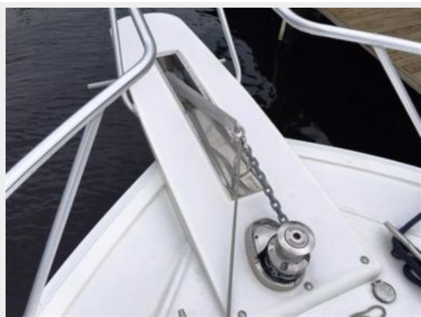
Anchor Windlass Platform