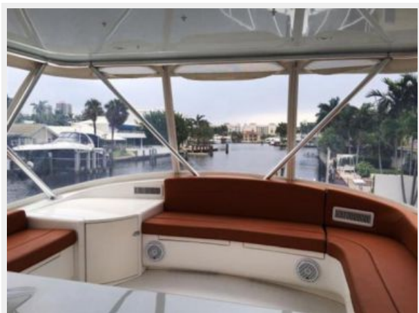
Bridge more seating