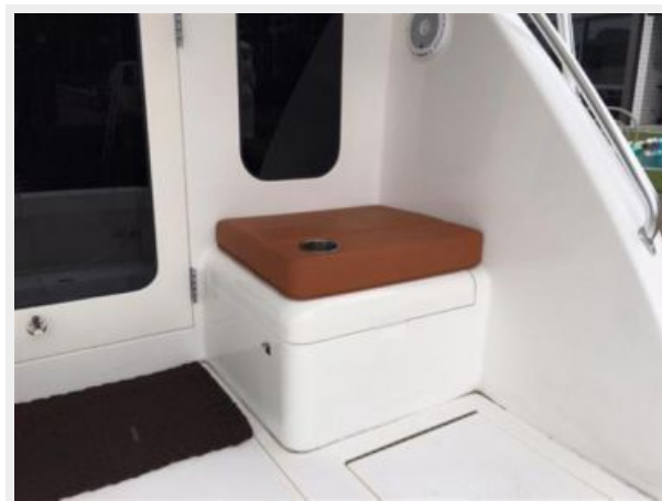
Starboard Cockpit Salon Entry