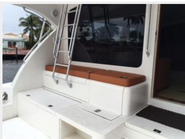
Port Cockpit Mezzanine Seating