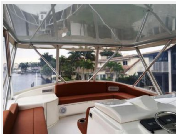
Bridge Custom Hardtop