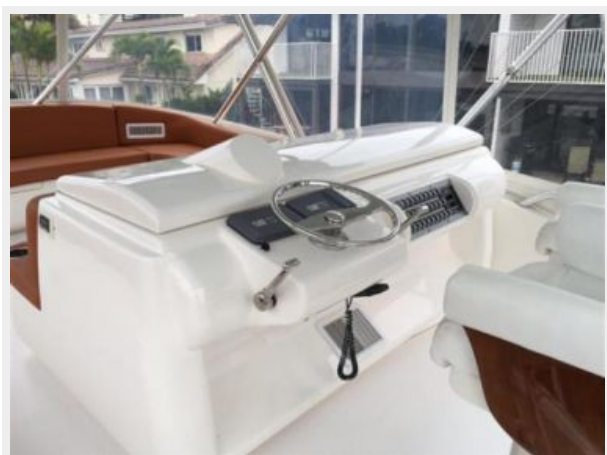
Bridge Console retracted