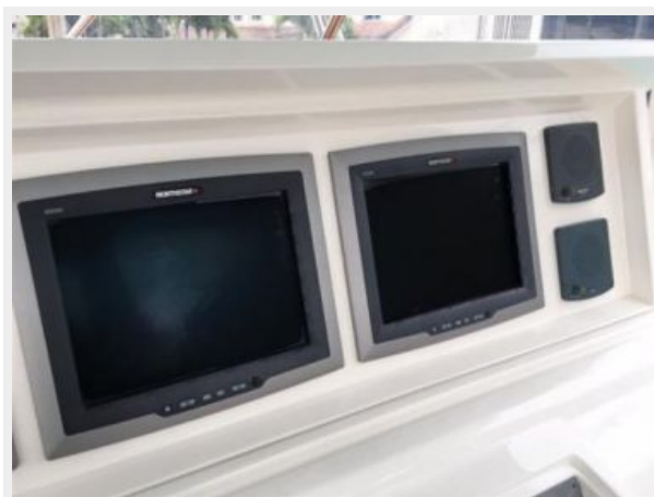
Northstar 8000i units