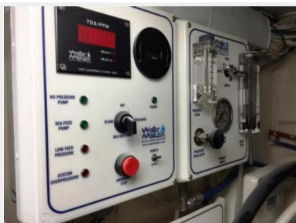
Water Maker 1