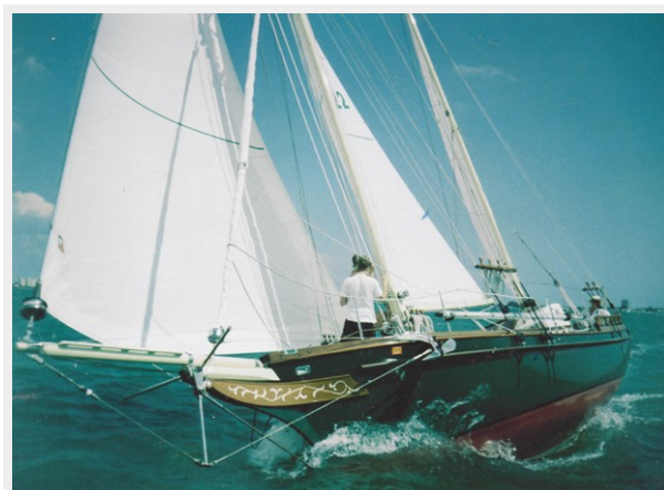
DOWN WIND WITH SPINNAKER FLYING