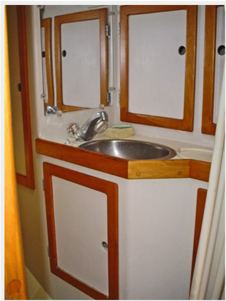
SS SINK WITH STORAGE