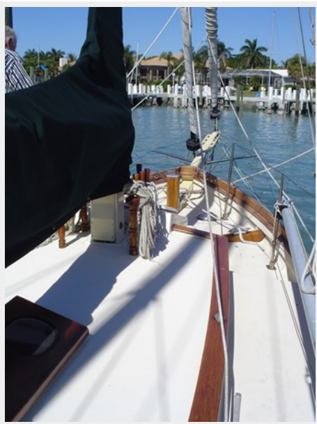
WIDE STARBOARD SIDE DECK-ROLLER FURLING GENOA & STAYSAIL