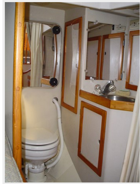
HEAD STAINLESS STEEL SINK AND MARINE TOILET FORWARD