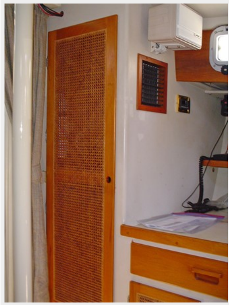
STARBOARD HANGING LOCKER FORWARD OF NAV STATION