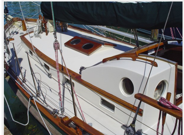
WIDE PORT SIDE DECK LEADING TO BOWSPRIT