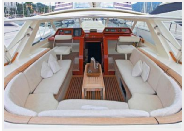
Outside dining area