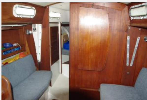
Forward bulkhead and table folded up