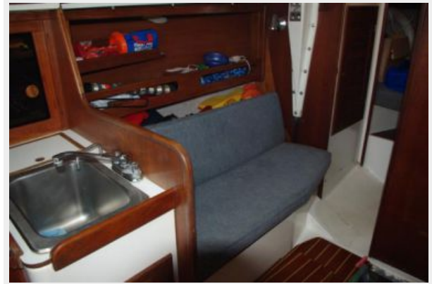
Port settee & sink