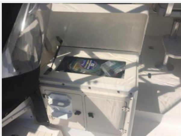
Cockpit Tackle Storage