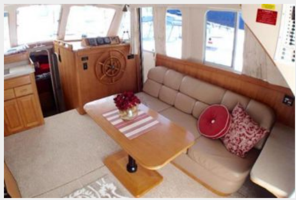
Salon Starboard Forward