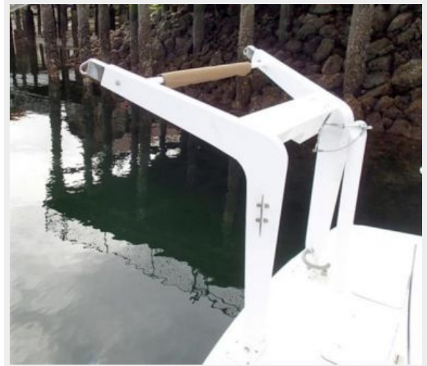
DC Davit System