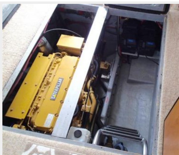
Engine Access Aft View