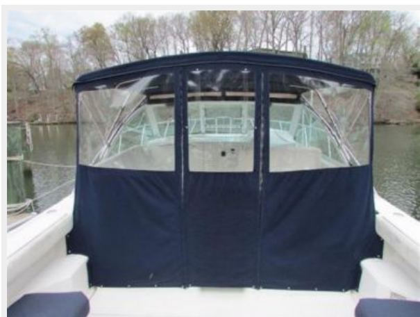
Tidy canvas enclosure