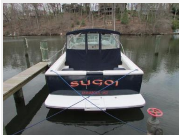
Stern w/ walk through transom to swim platform