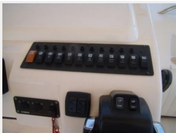
Helm / Electronics & Navigation 4