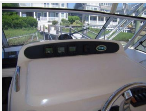
Helm / Electronics & Navigation 5