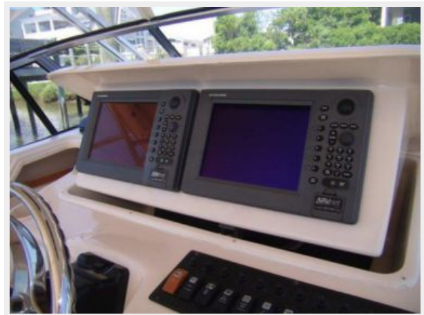
Helm / Electronics & Navigation 1