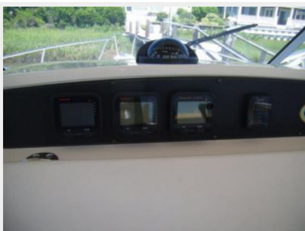
Helm / Electronics & Navigation 2