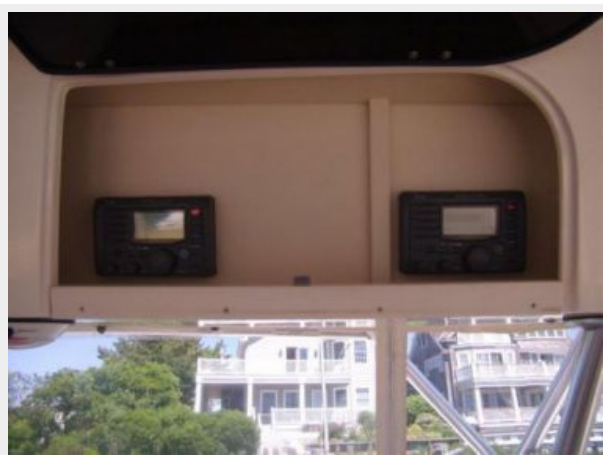
Helm / Electronics & Navigation 6