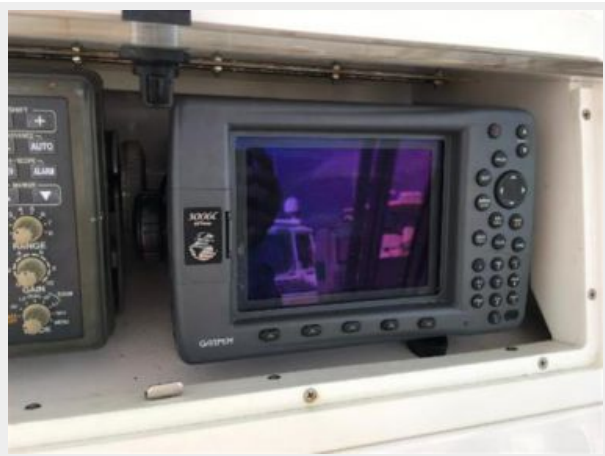
Garmin 3006C GPSmap