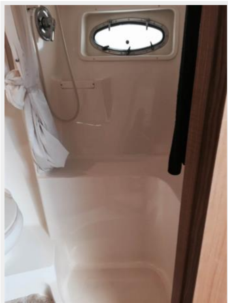
Shower with Curtain