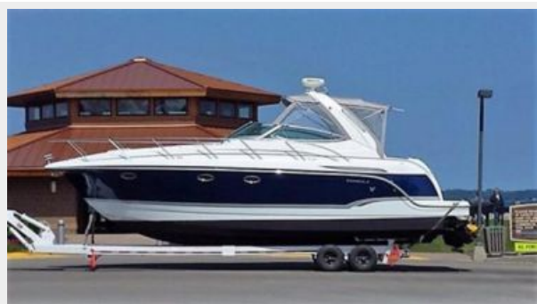
Port side profile