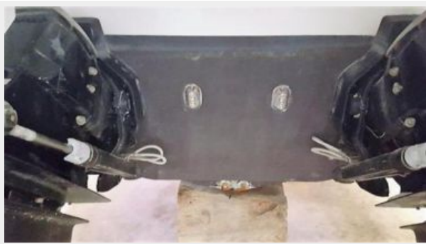
Custom underwater lighting