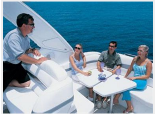
Aft Cockpit