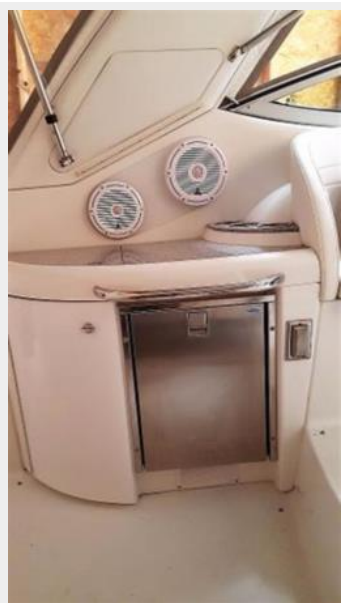
Cockpit refrigerator / wet bar to port