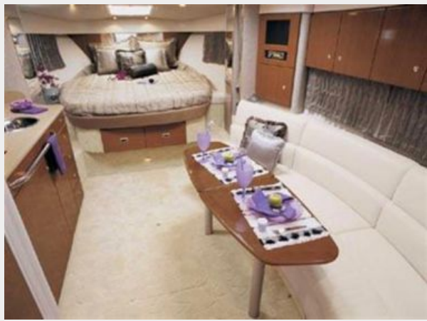
Main Cabin