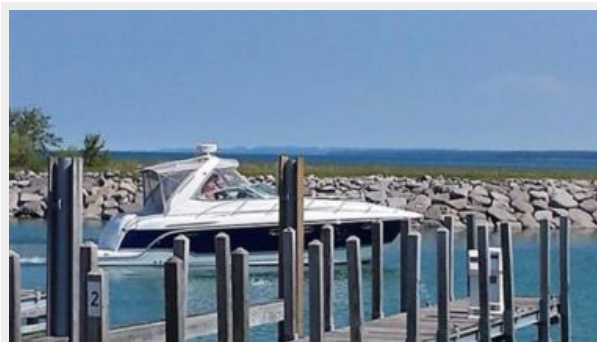
Bound for Fun