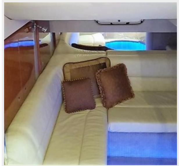
Aft Cabin