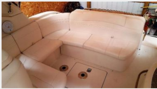
Aft Cockpit seating