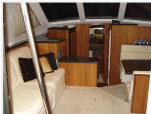
Manufacturer Provided Image: 404 Cockpit Motor Yacht