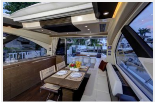
Salon with open sunroof