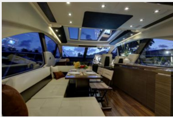
Salon facing bow