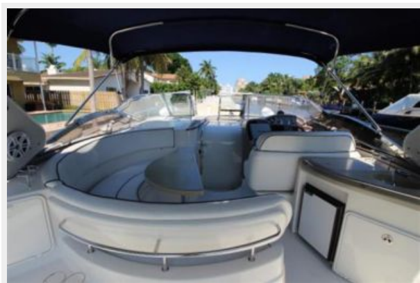
Seating & Wet Bar