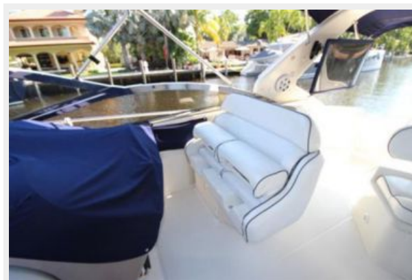
All New Covers