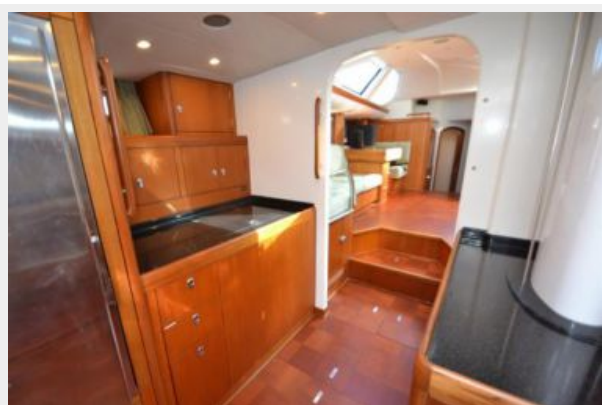
Galley forward of mast - starboard side view