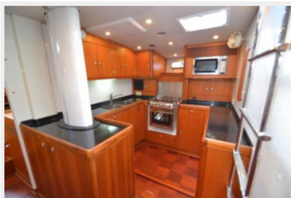
Galley forward of mast - port side