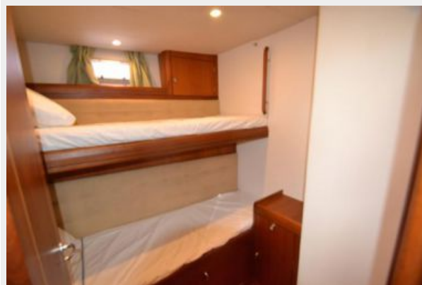
Aft starboard twin bunk cabin