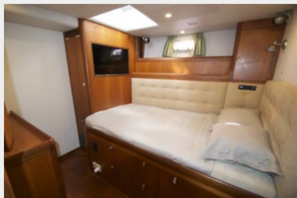
Aft port double guest cabin