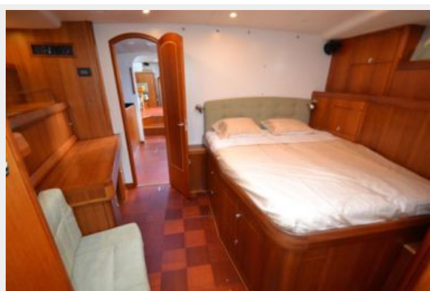
Forecabin looking aft