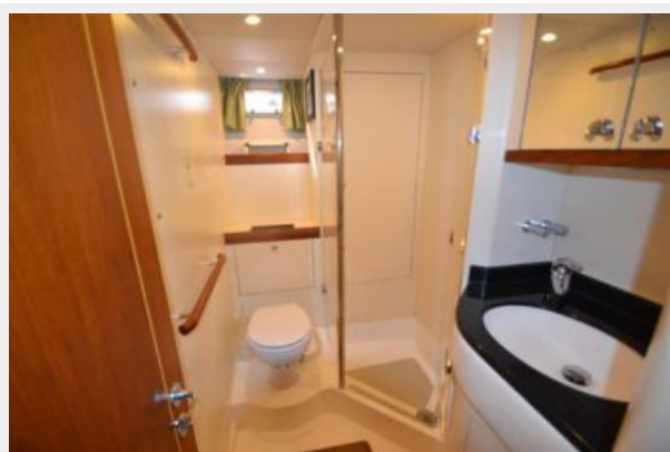
Day heads/double guest cabin en-suite