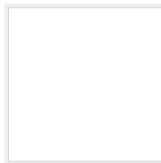
Large Hardtop Tiara installed in 2012