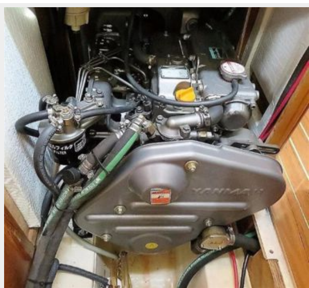
Super clean too