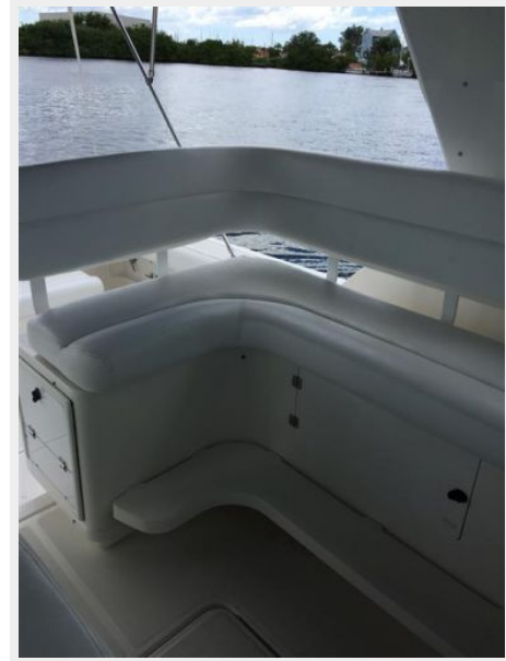
Companion Seat & Storage