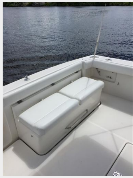
Aft Lounge Seating