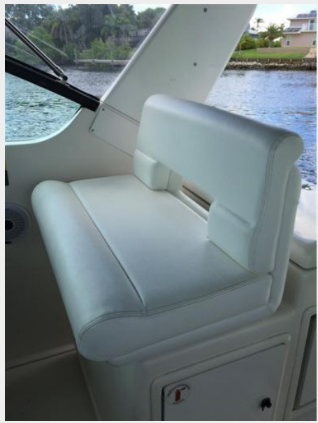
Double Helm Seat