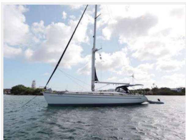
Bavaria 49 Curacao