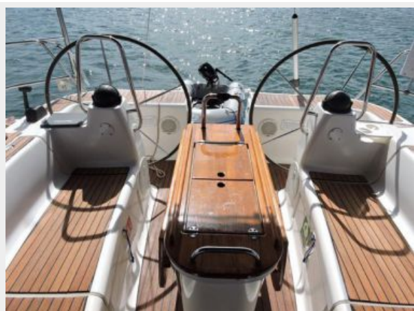
Bavaria 49 Cockpit