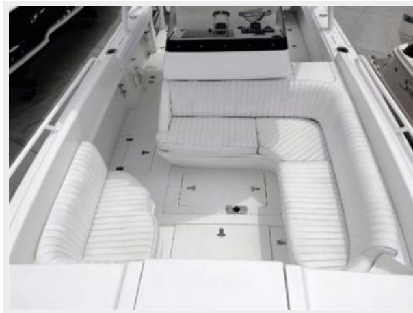
Seating Forward of the Helm