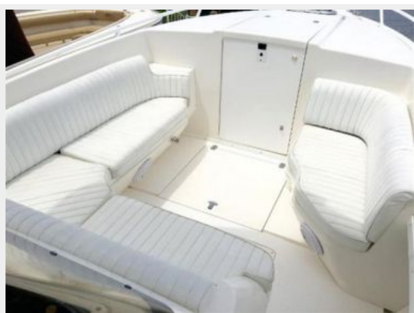
Entrance to Cuddy