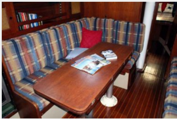
39' Cal salon table closed