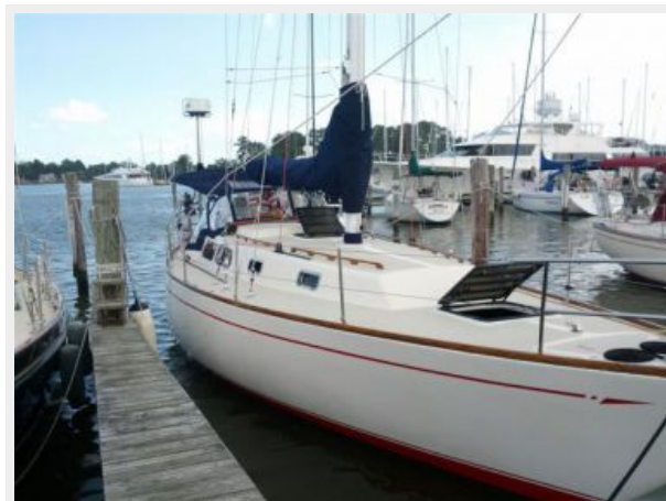
39' Cal starboard forward profile photo2