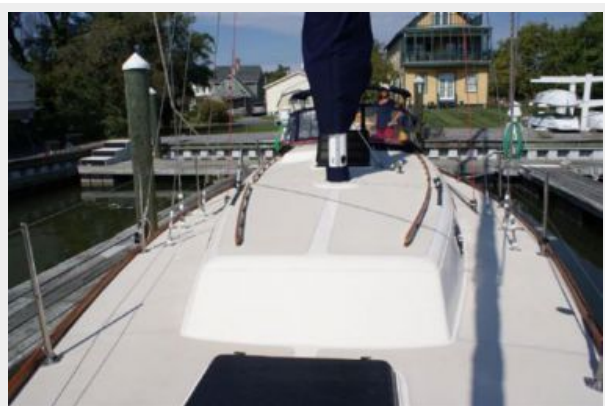
39' Cal foredeck aft