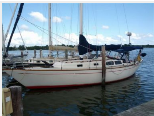
39' Cal port forward profile