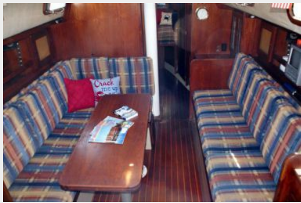
39' Cal salon forward