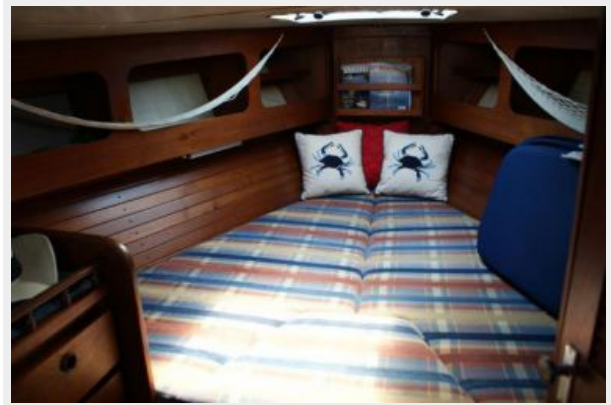
39' Cal stateroom