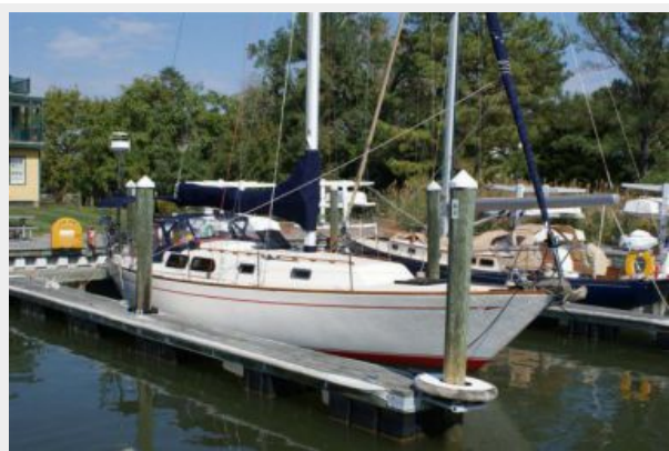
39' Cal starboard forward profile photo1