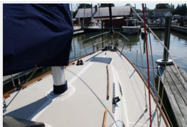
39' Cal foredeck