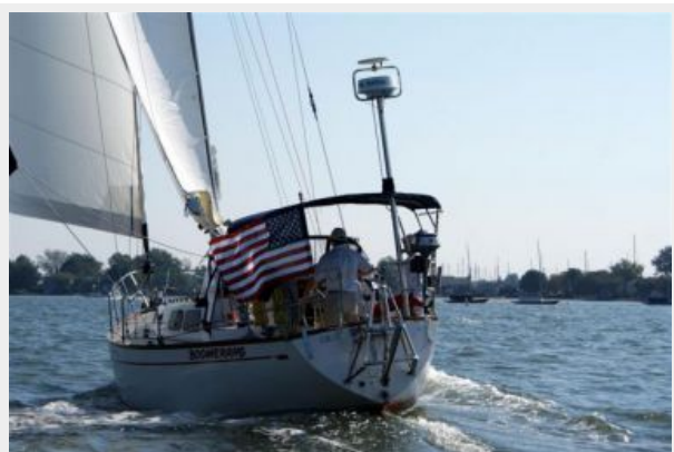
39' Cal underway photo3