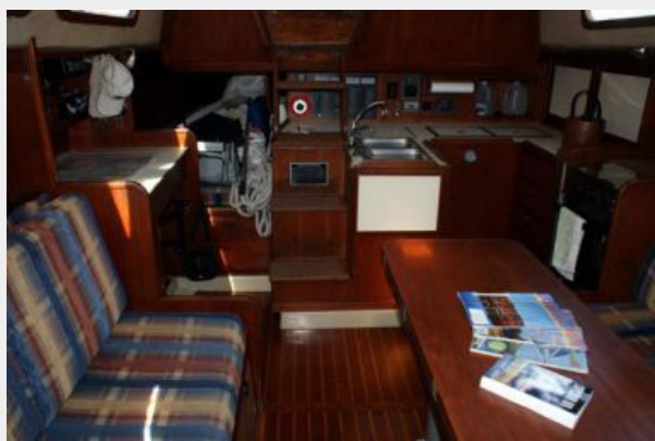
39' Cal salon aft