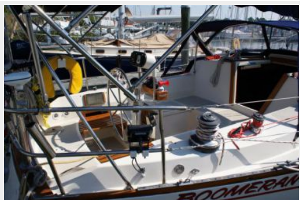
39' Cal cockpit photo2