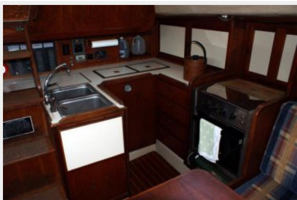
39' Cal galley