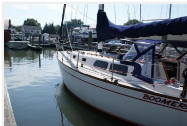
39' Cal port aft profile