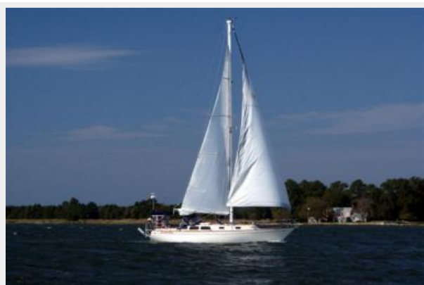
39' Cal underway photo1