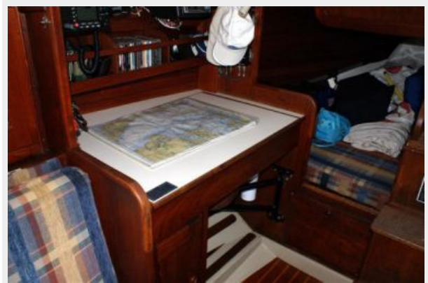
39' Cal nav station