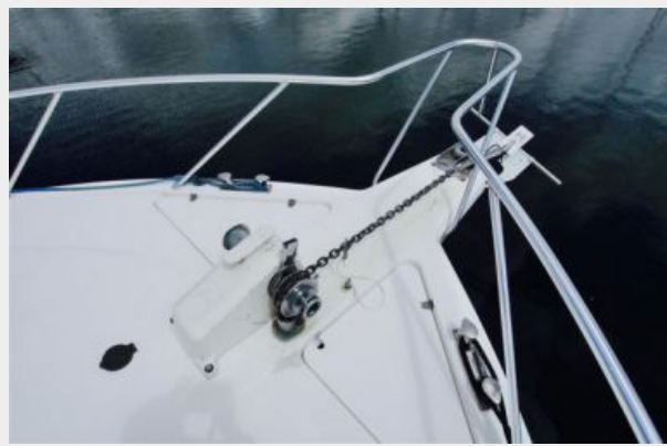
2001 Riviera 48