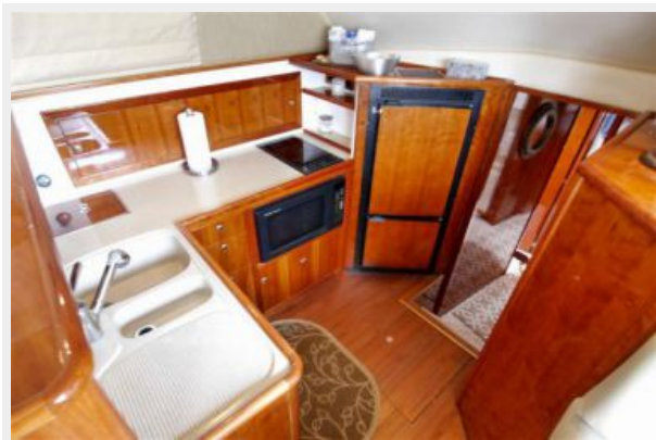
2001 Riviera 48