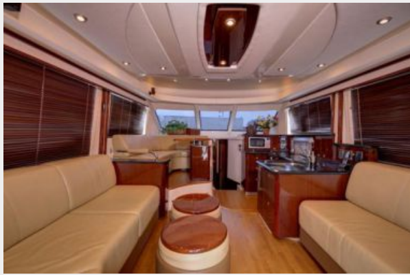
Salon facing bow