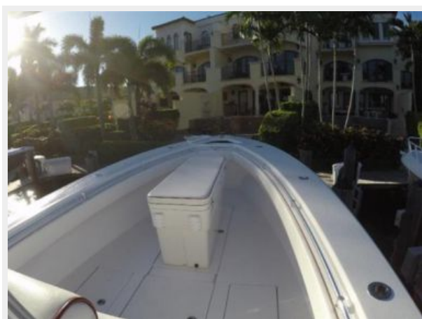
Bow Coffin Box