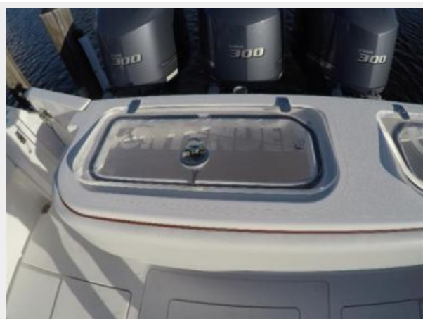
Starboard Live Well