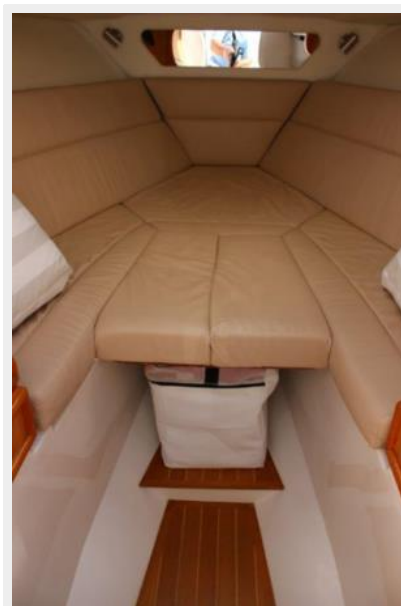
Cuddy Cabin 2