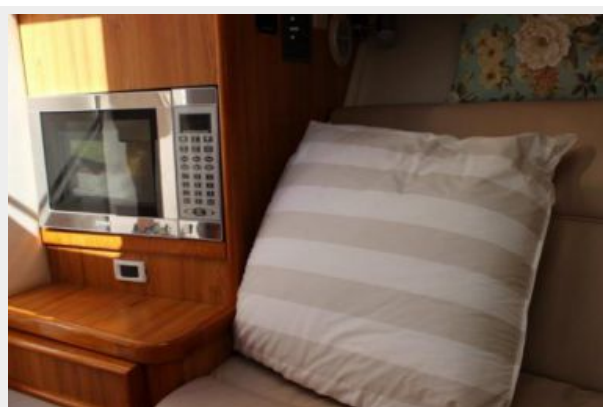
Cuddy Cabin 3