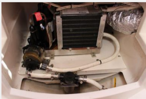
Engine & Mechanical Equipment 2 - AC