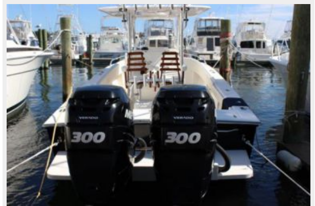
Engine & Mechanical Equipment 1 - 300 Verados