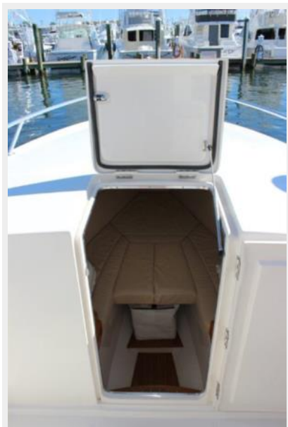
Cuddy Cabin 1 - Entry to Cuddy