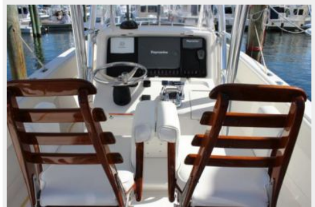
Helm / Electronics & Navigation 1