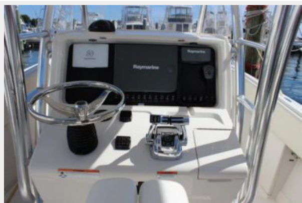
Helm / Electronics & Navigation 2