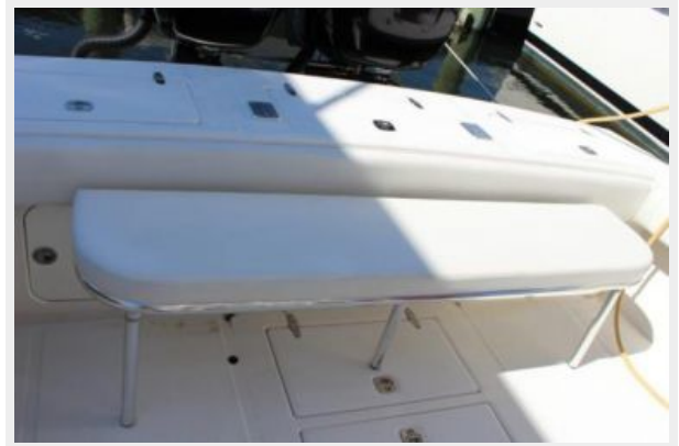
Deck 7 - Transom Seating