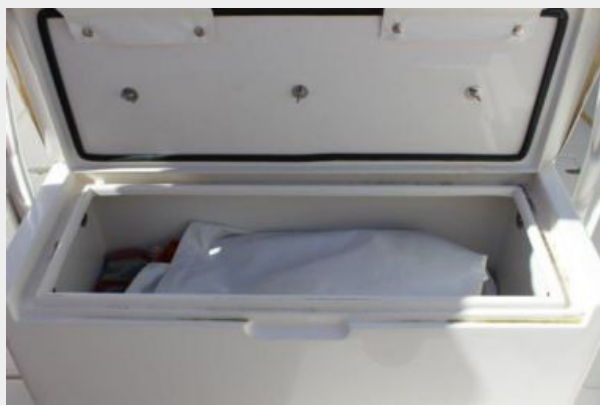
Deck 8 - Storage Under Forward Console Seating